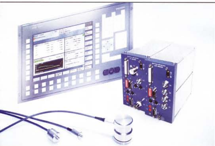
4 Anzeige auf dem Maschinendisplay: Beim ›DS6000‹ werden die Auswucht-, AE- und Messsteuersignale auf dem Maschinenbildschirm oder auf einer Fernbedienung dargestellt

Datenaustausch erfolgt über eine bidirektionale Übertragungsstrecke. Das rotierende Teil der Signalübertragung ist der Empfänger für die Energie der Wuchtmotoren und die Steuerbefehle und der Sender für die Acoustic Emission.